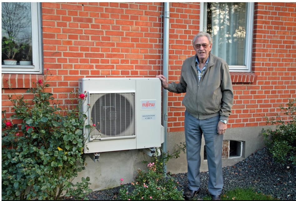
Tage ved ude-delen af sin varmepumpe